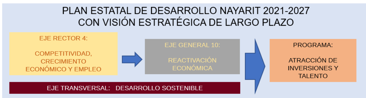
Ilustración 5 Derivación del Programa Sectorial del Plan Estatal de Desarrollo Nayarit 2021– 2027 con Visión Estratégica de Largo Plazo