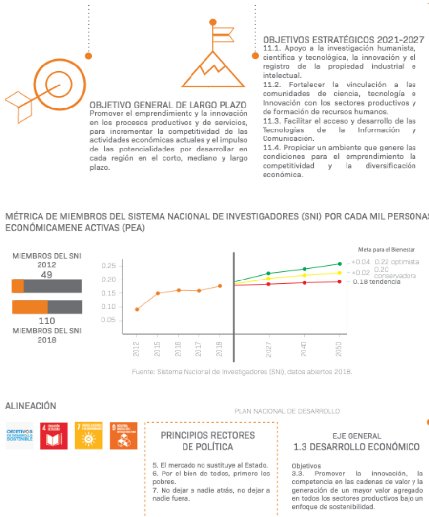
Ilustración 1 Objetivos generales y estratégicos del PED

(Imagen extraída del Plan Estatal de Desarrollo Nayarit 2021-2027 con Visión Estratégica de Largo Plazo)