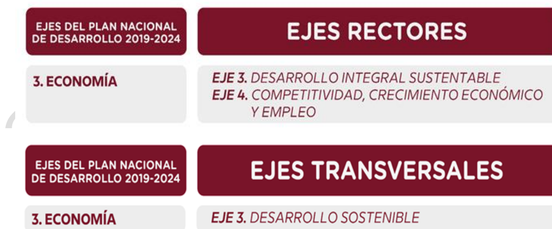
Ilustración 3 Ejes rectores y transversales del PED alineados al Plan Nacional

Figura: Vinculación del Programa Sectorial Atracción de Inversiones y Talento con el PND 2019-2024 y PED 2021-2027.